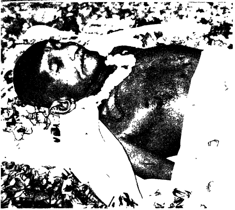
बापू : अन्नत निद्रा मे